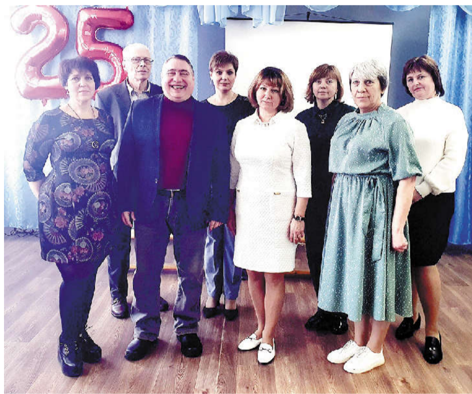
Коллектив педагогов Вязовенской основной школы.

обществознание. Ведет кружок истории. Активно участвует в районных и областных тематических конкурсах, печатается в районной газете.